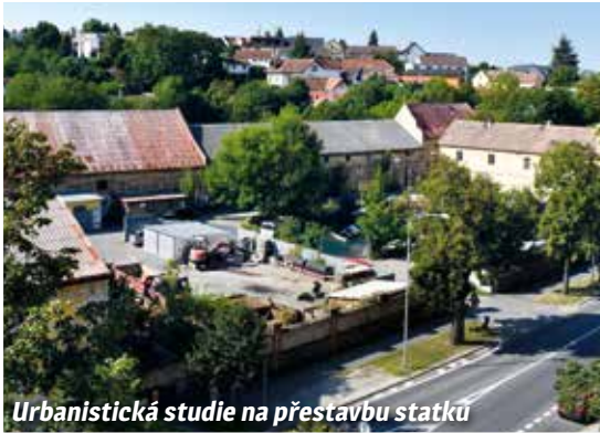
Urbanistická studie na přestavbu statků