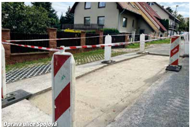
Oprava ulice Spojová