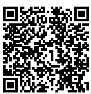
Odkaz na video: VČELOJED OBRANNÉ POSTAVENÍ