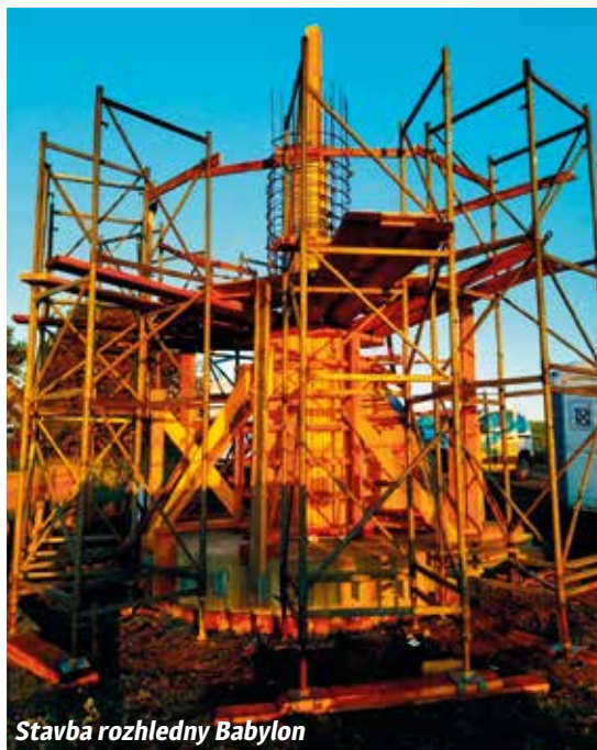
Stavba rozhledny Babylon