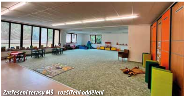
Zatřešení terasy MŠ - rozšíření oddělení