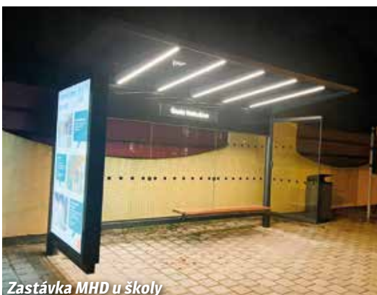
Zastávka MHD u školy