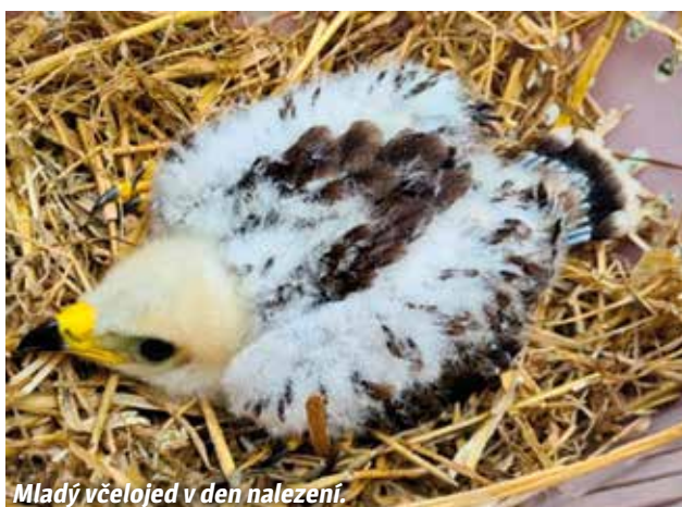
Mladý včelojed v den nalezání.