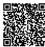
Odkaz na video: VČELOJED KRMENÍ