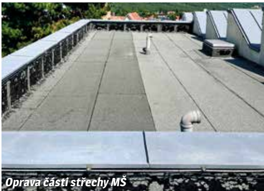
Oprava částí střechy MŠ