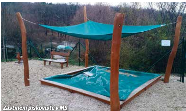
Zastínění pískoviště v MŠ