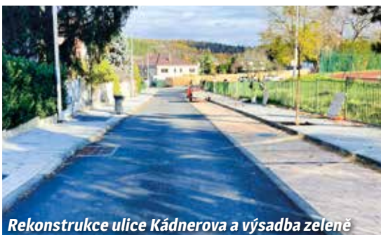
Rekonstrukce ulice Kádnerova a výsadba zeleně