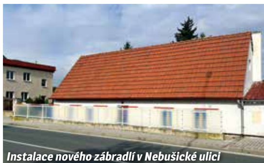
Instalace nového zábradlí v Nebušické ulici