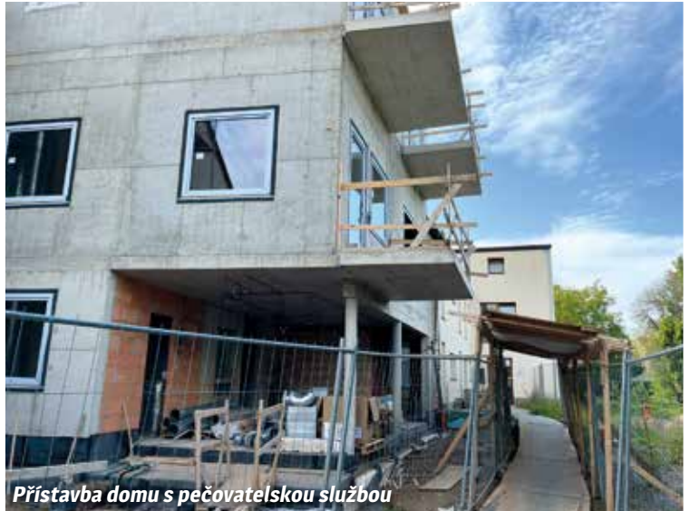
Přístavba domu s pečovatelskou službou