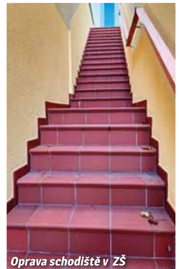
Oprava schodiště v ZŠ