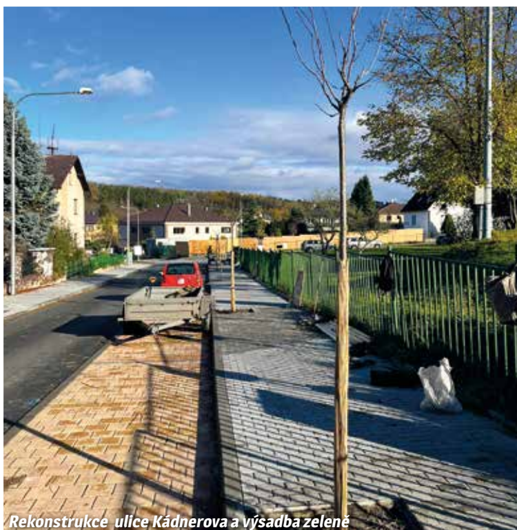
Rekonstrukce ulice Kádnerova a výsadba zeleně