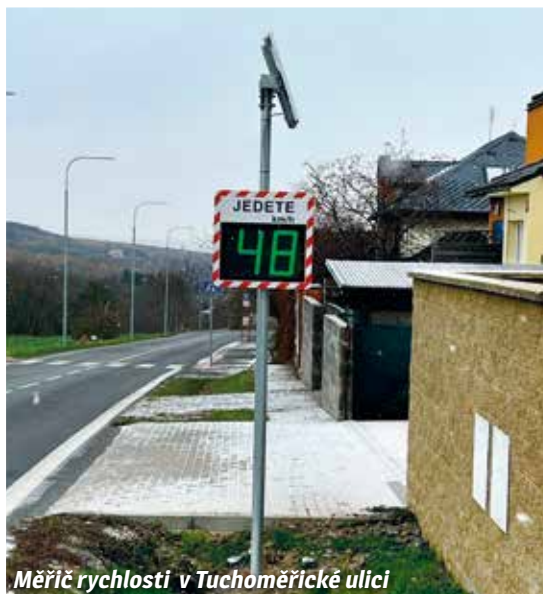
Měřič rychlosti v Tuchoměřické ulici