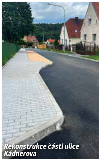
Rekonstrukce části ulice Kádnerova