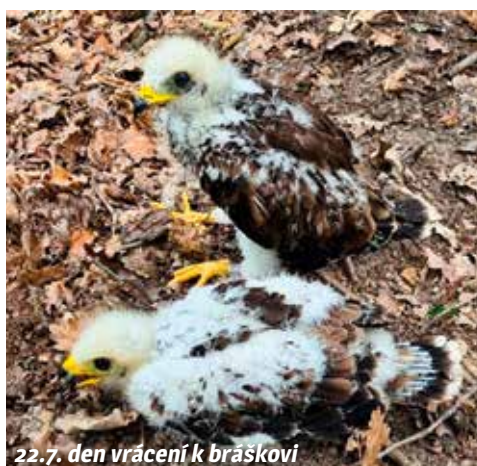
22.7. den vrácení k bráškově